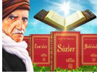
Bediüzzaman Said NURSI

Kısa Bir Ömürde, Az Bir Lezzet İçin; Ebedî, Daimî Hayatını Ve Saadet-İ Ebediyesini Berhad Etmek, Ehl-İ Aklın Kârı Değil. Ehl-İ Aklın Ve Zısuurun Kârı Olmadığından, Nefs-İ Emmarem İster İstemez Akla Tâbi' Olmuştur.