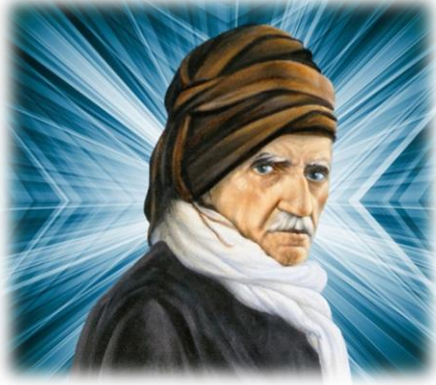
Bediüzzaman Said NURSI

Acaba sırf Dünya İçin mi yaratılmışsın ki, bütün vakitini ona sarf ediyorsun.